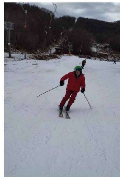
3. Col Parkinson si può sciare

Presso la sede sociale CAI – Via Peila, 1 – 1° piano – Rivarolo Canavese