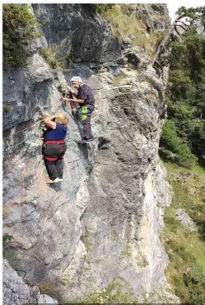
1. Col Parkinson su una via Ferrata