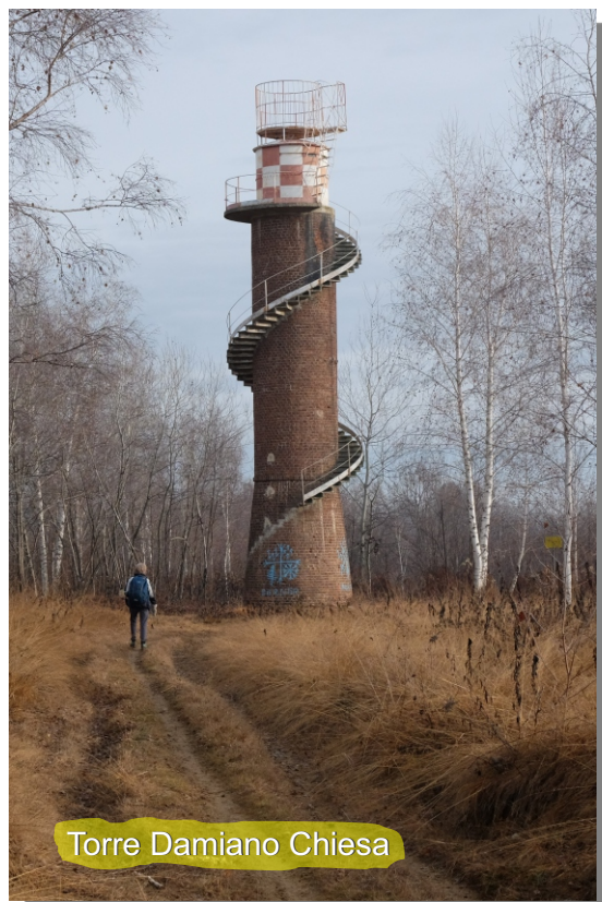
Torre Damiano Chiesa

Qui si riprende il sentiero che, tra boschi e brughiera, ci porterà alla stradina sterrata iniziale.